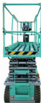
Noul design al PEA (platforma elevatoare autopropulsata) al pachetului de foarfece.