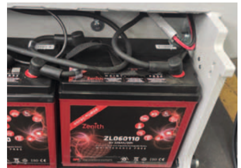
Compartiment pentru bateriile AGM