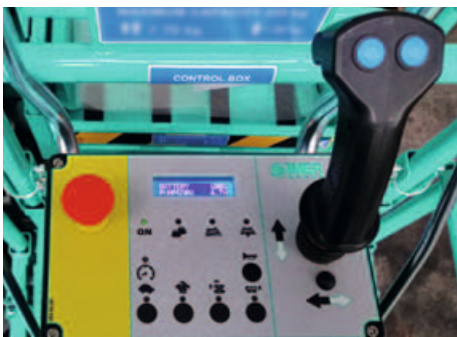
Panou de control detasabil cu butoane capacitive: simplitate si siguranta in utilizare