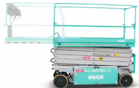
Extensie platforma 1.3 m.