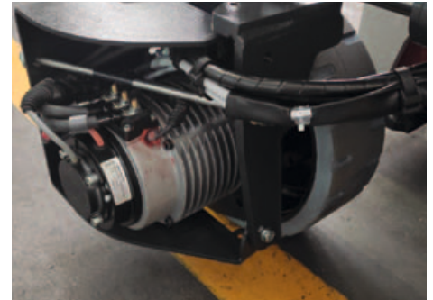
Motor electric AC; virare electrica pana la 90°